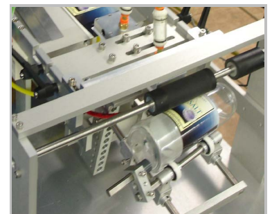
Каретка конической тары