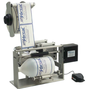
Стандартная модель R-310

Модель UniVersal R-310 Vacuum Transfer Grid построена на основе стандартной настольной полуавтоматической этикетировочной машины R-310, и предназначена для нанесения самоклеящихся этикеток на круглые упаковки в форме усеченного конуса. Для этого модель UniVersal R-310 VTG оборудована регулируемой отделительной пластиной и вакуумной решеткой, удерживающей этикетку после ее отделения, что позволяет серповидным этикеткам поворачиваться по мере накручивания на коническую поверхность тары. Корпус машины выполнен из нержавеющей стали и анодированного алюминия. Она комплектуется специальной кареткой, учитывающей особенности конической упаковки. В случае необходимости может использоваться адаптированный ролик проворачивания упаковки. Старт цикла наклейки этикеток осуществляется нажатием ножной педали оператором. Машина позволяет наклеивать самоклеящиеся этикетки в рулонах с внутренним диаметром 76 мм и внешним до 30 см. Для работы используется сжатый воздух.